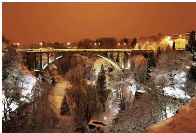
Pont de sidi Rached